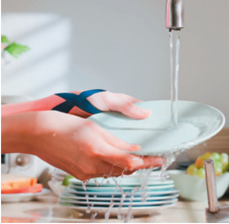
Kann auch im Wasser genutzt werden