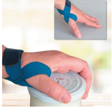
Entlastung bei Alltagstätigkeiten