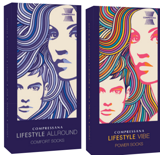
COMPRESSANA LIFESTYLE Kniestrümpfe

Besonders modisch wird es mit LIFESTYLE VIBE – die trendigen Strümpfe werden mit Ringeloptik oder pinken Dots und Komfortbündchen zu stylischen Alltagsbegleitern.